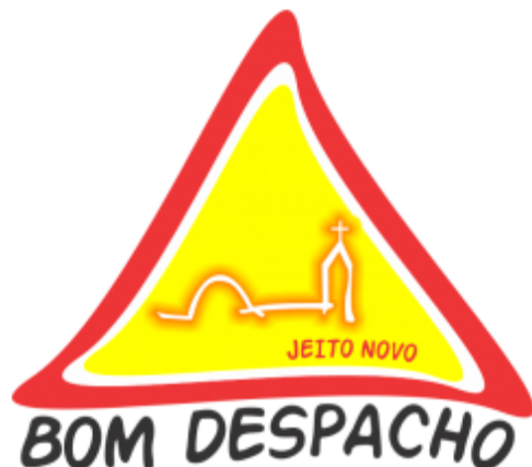
Figura 01 - Logomarca

Logomarca da administração municipal e Brasão a serem utilizados: