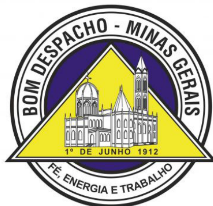
Figura 02 - Brasão